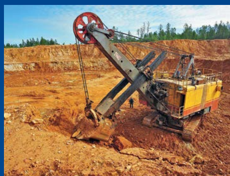
ДОБЫЧА ПОЛЕЗНЫХ ИСКОПАЕМЫХ