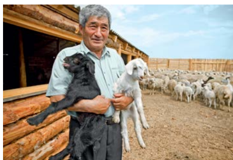
Разведение овец грубошерстного направления