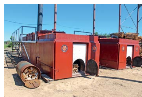
Байкальская древесноугольная компания