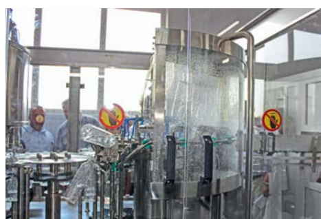
Завод по производству бутилированной воды

Даже в неблагоприятных условиях можно найти свободную нишу, вложить деньги и получить прибыль. Рекомендую нашим предпринимателям искать пути развития, сферы, куда можно направить свою энергию, а мы готовы им в этом помогать. Тем более что работаем мы на безвозмездной основе, что в нынешних условиях очень приятный бонус.